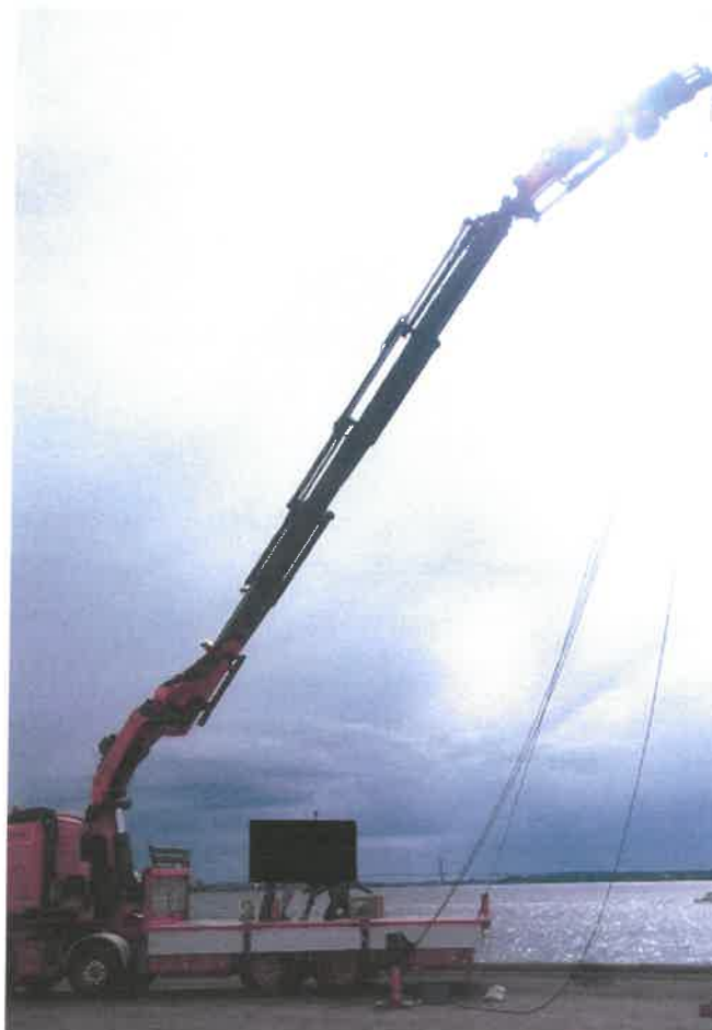
II.1. Przykładowy model dźwigu równoważny z przedmiotem zamówienia.